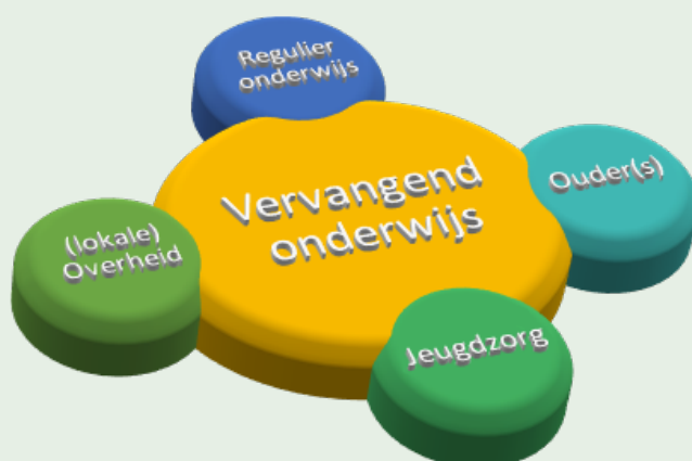
Figuur 2: Vervangend onderwijs in de context van het mbo en mogelijke betrokken partijen

Positionering van de vervangende programma's ten opzichte van het reguliere mbo-onderwijs heeft onder andere te maken met de doelstellingen en uitgangspunten van het initiatief. Vervangend onderwijs dat tot doel heeft dat de jongere weer terug gaat naar het mbo en een startkwalificatie haalt, werkt nauw samen met het reguliere onderwijs. Docenten van het mbo zijn bijvoorbeeld in nauw contact met het vervangende onderwijs en stimuleren mbo-studenten om een vervangend programma te gaan volgen, zij geven soms ook lessen, workshops of trainingen op de locatie van het vervangende programma. Soms worden de programma's ontwikkeld in samenwerking met mbo-scholen om als vangnet te dienen voor de jongeren van die instellingen. In de praktijk is er ook afstemming met de lokale overheid met name als de jongeren leerplichtig zijn. Omdat er vaak sprake is van meervoudige problematiek wordt er waar nodig samengewerkt met partners uit de gezondheids- en welzijnssectoren, lokale jeugdwerkers, de verslavingszorg, de GGZ schuldhulpverlening, vluchtelingenwerk, reclassering, maatschappelijk werk et cetera.