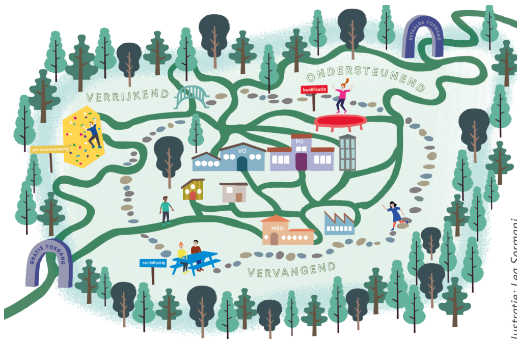
Illustratie: Lea Sormani

2 Elffers, L., Fukkink, R., Jansen, D., Helms, R., Timmerman, G., Fix, M. & Lusse, M. (2018). Aanvullend onderwijs: leren en ontwikkelen naast de school. Een verkennende schets van het landschap van aanvullend onderwijs in Nederland . Amsterdam: NWA.